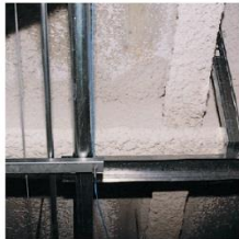
Flocage sur une poutre derrière un faux plafond