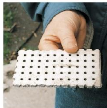
Tuiles de faux plafond