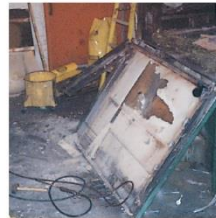
Isolant sur une porte de four