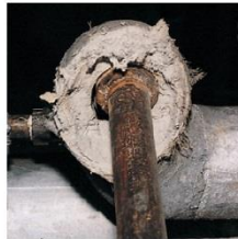
Calorifugeage sur un tuyau