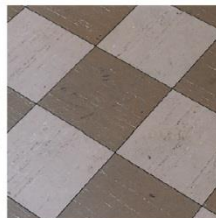
Carreaux en vinyle